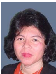
M.A. Corazón de María Madrigal

Horario de atención 8:00 - 16:00 Lun a Vie