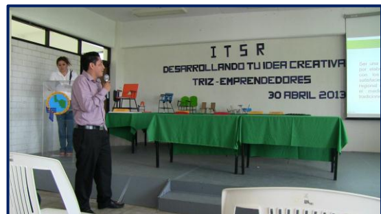
Presentación de Proyecto.